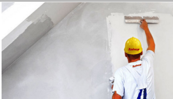
3.2 - Massa única para parede interna ou externa, com argamassa pré-fabricada, adesivo de alta resistência - Espessura até 30 mm inclusive andaimes e demais acessórios para a perfeita execução do serviço