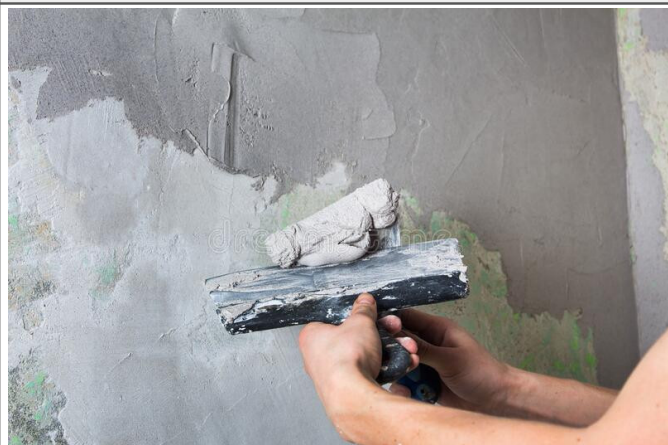
3.2 - Massa única para parede interna ou externa, com argamassa pré-fabricada, adesivo de alta resistência - Espessura até 30 mm inclusive andaimes e demais acessórios para a perfeita execução do serviço