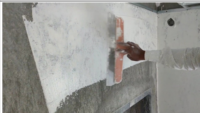
3.2 - Massa única para parede interna ou externa, com argamassa pré-fabricada, adesivo de alta resistência - Espessura até 30 mm inclusive andaimes e demais acessórios para a perfeita execução do serviço